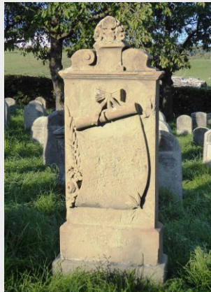
Grabstein mit Schmucksymbolen

Die ländlichen Gemeinden werden Schauplatz jüdisch religiösen und wirtschaftlichen Lebens. Rund 90 jüdische Friedhöfe in Franken zeugen heute noch davon. Zwei der drei jüdischen Friedhöfe im Landkreis Forchheim befinden sich auf dem Gebiet der Marktgemeinde Pretzfeld.