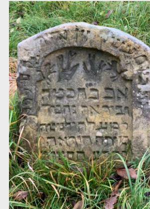
Symbol: Segnende Hände

Geblichen sind als „steinerne Archive“ die beiden jüdischen Friedhöfe in Pretzfeld und Hagenbach.