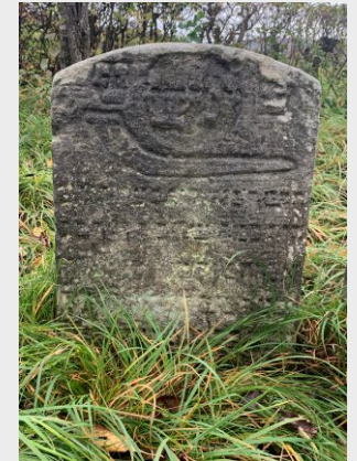
Grab eines Schofarbläusers